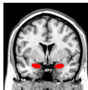
扁桃体体積 FreeSurferにて測定